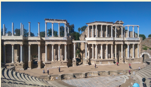
Théâtre romain de Mérida