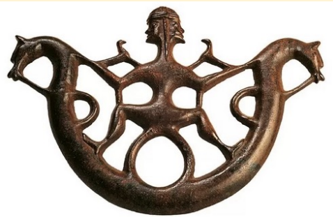
Civilisation de Tartessos (-X ème -V ème s.)