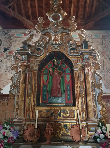
Ermitage de San Torcuato, disciple de Saint Jacques, un des « siete varones », premier évêque d'Espagne (Guadix)