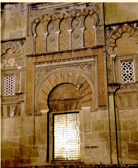
Porte Mosquée de Cordoue